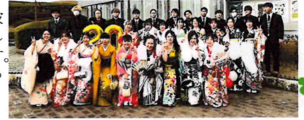
宗像市833人（玄海中卒業43人）