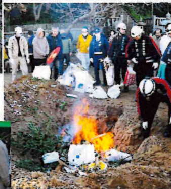
消防団による火入れ