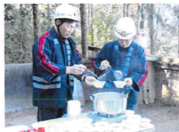
消防団のぜんざい振る舞い