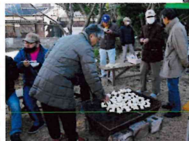
鏡餅とぜんざいの振る舞い