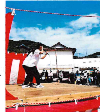
城東高校ダンス部