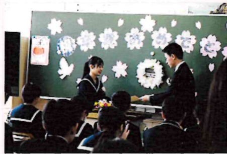
玄海中学校卒業生30人

3月8日に玄海中学校、3月14日に玄海小学校、地島小学校で卒業式が行われました。コロナ禍を経験した子どもたち。様々な思いを胸に新しい未来に向けて巣立っていきます。