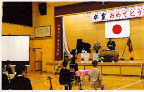
地島小学校卒業生1人