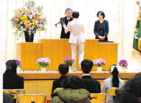
玄海小学校卒業生22人