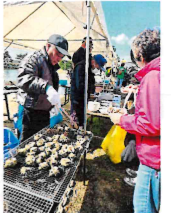
サザエの炭火焼き