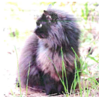
椿祭りの賑わいを興味深そうに眺めていました。 3月9日地島