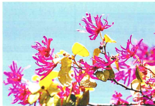
リボンのような花が咲いています。 3月13日 大島