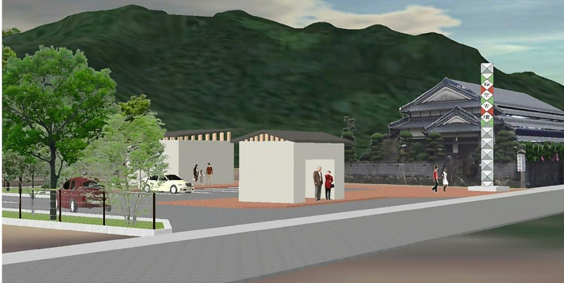
(図 Ⅱ-7-25 駐車場整備イメージ)