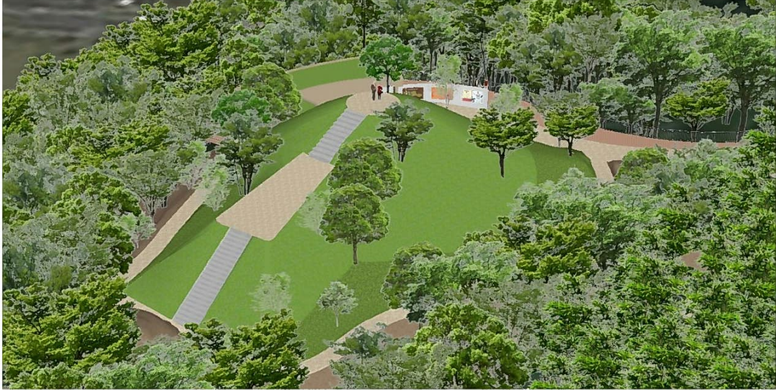
（図 Ⅱ-7-27 古墳整備イメージ 南側鳥瞰）