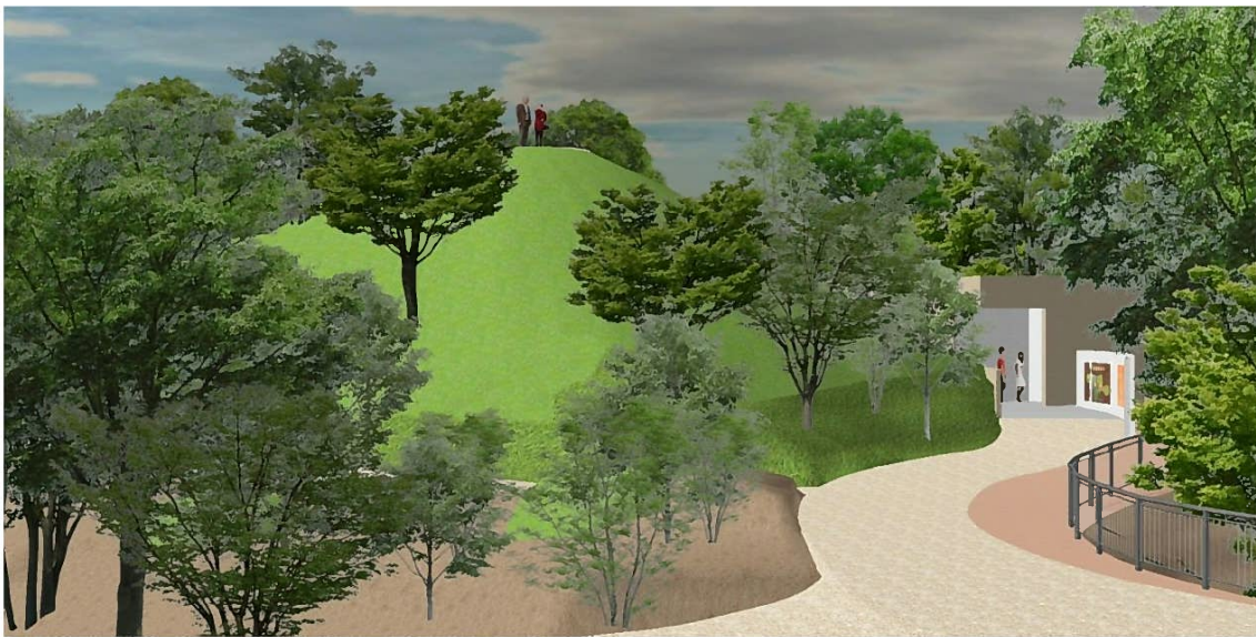
（図 Ⅱ-7-28 古墳整備イメージ 中心地から石室保護施設を望む）