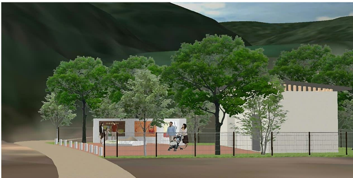
(図 Ⅱ-7-26 ガイダンス広場整備イメージ)