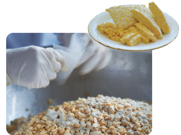
蒸した大豆を一粒ずつ選り分けてテンペ菌をまぶす。大豆の目利きだからその丁寧な作業で美味しいテンペに仕上がっています。

宗像市で大豆を生産している女性グループが、宗像でとれた大豆の魅力を知ってもらうためにさまざまな大豆製品を加工・販売しています。なかでもこだわっているのが、蒸した大豆をテンペ菌で発酵させたインドネシアのスーパーフード「テンペ」です。味のクセが少なく、いろいろな料理でアレンジできる大豆+発酵の食品です。