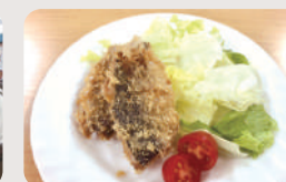
中学2年生を対象にした魚さばき教室。さばいた後はフライに。