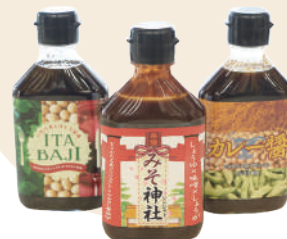
バジルの風味香るイタバジはじめ、味噌やカレーなどユニークな味わいの醤油に