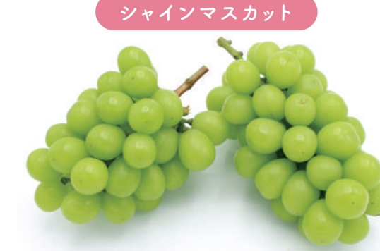
シャインマスカット

宗像で栽培が広がるシャインマスカットは、ふるさと寄附で人気上昇中。スイーツの食材としてパティシエも注目。