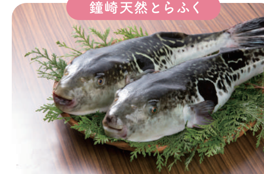
鐘崎天然とらふく

宗像市すすき牧場産のブランド牛。お米を使ったこだわりの自家製飼料で健康に育てるしっかりした赤身の旨味が評判。