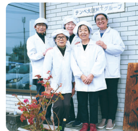
JAむなかたアグレス「テンペ大豆加工グループ」のみなさん