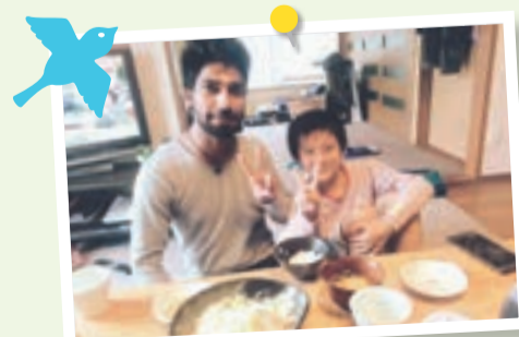
自宅で国際交流してみませんか