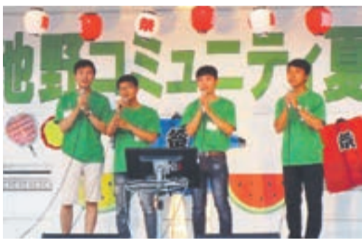
ベトナムの歌を披露する研修生