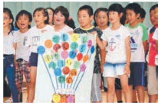
3年1組のスローガン発表

明治43年、野坂尋常高等小学校として開校。児童数209人(7月1日現在)。同小のキャラクター「南ちゃん」「郷くん」「小子ちゃん」に合わせ、「南ちゃんタイム=勉強」「郷くんタイム=運動」「小子ちゃんタイム=読書」で知、徳、体をバランスよく鍛えています。