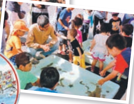
景品付き餅まきの様子 (上) タッチングプールでヒトデなどと 触れ合う子どもたち (下)

毎月第2日曜日に、鐘崎漁港の鐘の岬活魚センターで行われている「お客様感謝祭」。9月は、世界遺産登録を記念して、また、全国豊かな海づくり大会の48日前イベントとして「お客様大感謝祭」を盛大に開催します。漁協食堂(*)や、海の生物と触れ合えるタッチングプールなど、子どもから大人まで楽しめる1日です。みなさん、ぜひ遊びにきてください。