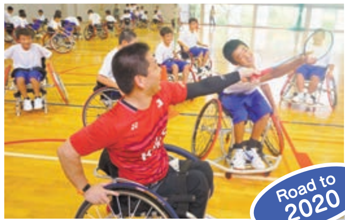
選手と、競技用車いす体験をする 生徒たち