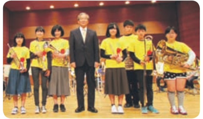
大きく成長した卒団生

宗像ユリックス・ハーモニーホールで3月30日に開催された、ユリックスジュニアプラス第三期生6年生の卒団式に行ってきました。