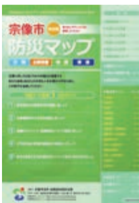
宗像市防災マップ

△避難準備情報 ↓ 避難準備・高齢者等避難開始 ▽避難勧告 ↓ 避難勧告 ▽避難指示 ↓ 避難指示（緊急） ＊詳細は、同マップ1ページ参照