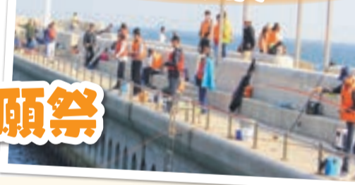
防波堤釣りの様子

うみんぐ大島は、4月で開業7年目を迎えます。これを記念して、誕生祭を開催。当日は、お得な釣り体験の他、1年間の安全と好釣果を祈願する「大漁祈願祭」を実施します。