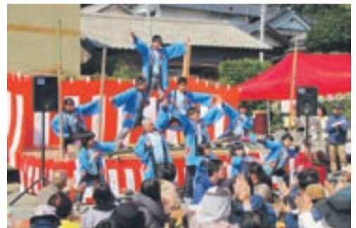
漁村留学生のパフォーマンスで盛り上がりました