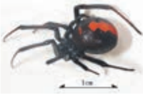
セアカゴケグモ (メス) (毒があります)