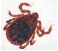
マダニ (毒はありません)

【マダニ】 体長は、約3mm〜1cm。春から秋にかけて活動し、ササ類などの葉先などに集まって、宿主(鳥、動物、人)が通ったときに寄生します。通常は、3、4mm程度の大きさですが、血を吸うと1cm以上になります。毒はありませんが、吸血時に注入する唾液によって、病原体を媒介する場合があります。