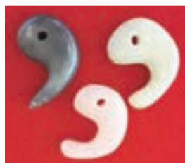
好きな色のまが玉が作れます

正月は特別色の白、ピンク、黒の中から好きな色を選んで、オリジナルまが玉を作ります。