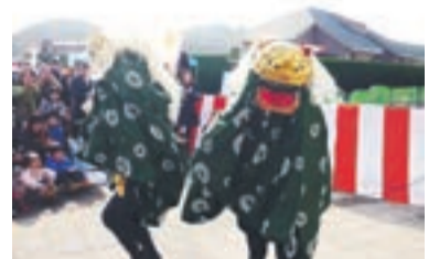
獅子舞を見て良い年にしましょう

昔から良い年を迎えられるようにと、正月などの縁起の良い日に行われてきた獅子舞。ミニ獅子舞がもらえるチャンスがあるかも!?