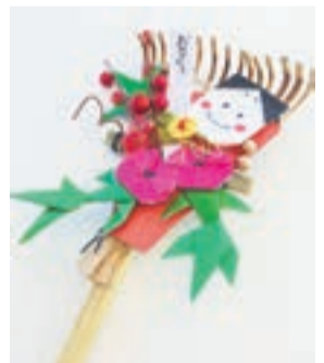
自分だけの熊手を作りましょう

●日時 平成29年1月1日(日・祝)~同3日(火) 14:00から1時間程度 ●定員 各日先着30人 ●参加料 300円