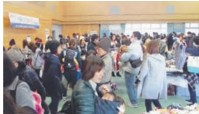
多くの参加者でにぎわう会場 (昨年の様子)