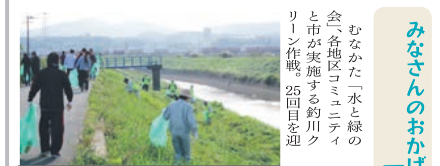
多くの参加をありがとうございました

■問い合わせ先 ▽環境課 ☎(36)1421 ▽NPO法人むなかた子育てネットワークこねっと FAX(36)3741 E-mail konet_munakata@yahoo.co.jp