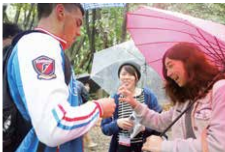
宗像大社のガイドの様子