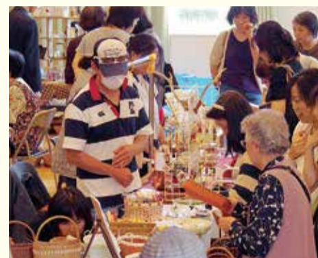
すてきな作品と多くの人でにぎわいます

「One day market」では、市内外から集まる作家の布小物、服、かばん、アクセサリーなどの雑貨販売ブースやワークショップでの物作り体験ブースが並びます。同時に、TMA会の「寄れ寄れ喫茶」も開かれ、思い思いに楽しい時間を過ごせる「場」となっています。