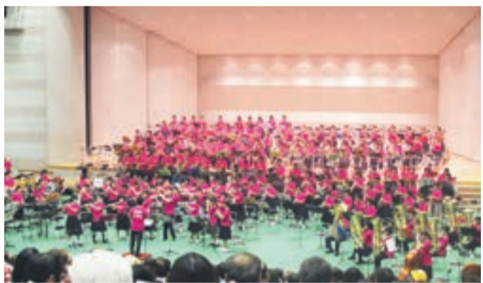
大迫力のミアレ吹奏楽団300人コンサート

宗像新市制10周年、宗像ユリックス開館25周年を記念して始まった「宗像ミアレ音楽祭」も今年で4回目。今年9月24日、同25日の2日間にわたって、宗像ユリックス全体に音楽と歌声が響きわたりました。 約100人の小学生によるミアレジュニア合唱団の歌声や、宗像・福津市内の中学校のブラスバンド部員、社会人のブラス愛好家総勢約300人の「ミアレ吹奏楽団」の大合奏の響きは、会場を震わせるほどの大迫力を感じました。 市内のあちらこちらで活躍する子どもや大人たちの音楽の集大成の場でもある「宗像ミアレ音楽祭」は、宗像市民の市民力、そして文化の高さを示すバロメーターであり、市の財産として今後も続けていきたいと思えます。 市☎http://www.city.munakata.lg.jp/でも、市長ブログを紹介しています。 ■問い合わせ先 秘書政策課秘書担当 ☎(36)0890