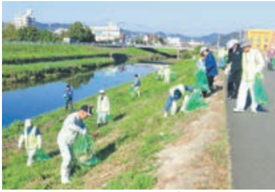
みなさんのおかげで釣川の土手がきれいになります(昨年の様子)

むなかた「水と緑の会」と市では、第25回釣川クリーン作戦を10月30日(日)に実施します。