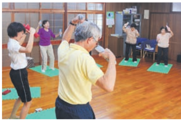
参加者のみなさんと一緒に汗をかきました

* 赤間西コミセンの教室は、誰でも参加することができます ■問い合わせ先 赤間西コミセン ☎(38)9506