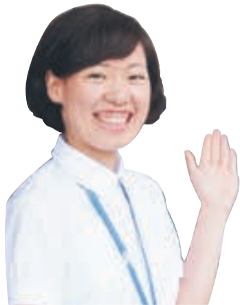
畑中生活支援コーディネーター