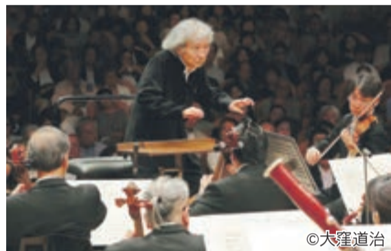
指揮者の小澤さんとサイトウ・キネン・オーケストラ