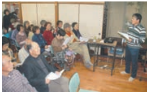
熱心に撫中先生の話聞く参加者のみなさん

「認知症にならないためには、脳の疲労を少なくし、良いイメージを多く取り入れ、ストレスをためないことが一番」という言葉に、参加したみなさんは思い当たるところもあるようで、笑いのあふれる楽しい健康教室でした。 「地域に密着し、普段から健康相談が受けられるかかりつけ医として、地域医療に取り組み、区民のみなさんの力になりたい」と話す撫中先生。お互いの顔が見える「地域づくり、地域医療」を身近に