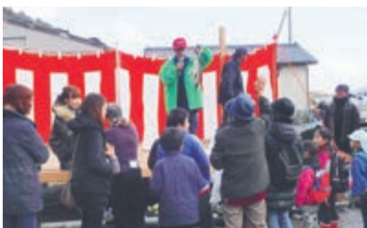
束の間の晴れ間で実施したステージイベント

今年で15回目を迎えた地島椿まつりが、3月12日、泊地区(泊港)をメイン会場に開催されました。催されました。メディアで紹介されたこともあって、雨天にも関わらず、500人を超える来島者がありました。 ステージイベントは、午前の部の内容を一部変更、午後の部は、雨脚も強まり、全てのアトラクションが中止に。それでも午前中は、1時間程度の晴れ間の中、地島ゆりの樹幼稚園の園児、地島小学校児童によ ■問い合わせ先 商工観光課 元気な島づくり係 ☎(72) 2211