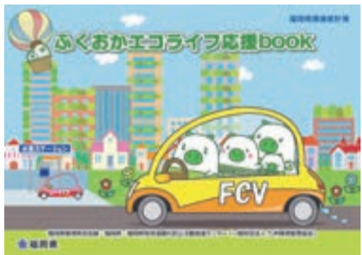
電気などの使用量を記入するエコライフ応援book

■問い合わせ先 ▽市環境課 ☎(36)1421 ▽県環境保全課 ☎092(643)3356