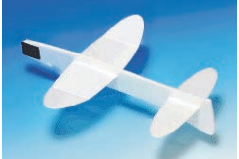
おえかきプレーン