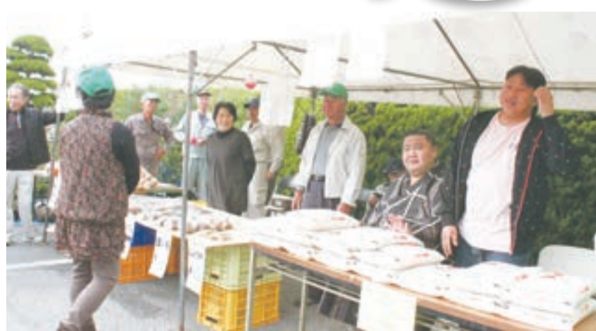
大繁盛だった農業まつりでの出店ブース

昨年11月21日〜同22日、JA本店で開催された「農業まつり」に農業委員会も出店。委員のみなさんが心をこめて作った新鮮な農作物を、安い価格で直接販売し、午前中ほとんど完売することができました。 その短い時間に、多くの人と接し、農政・農事に関する談話が弾み、意義ある活動になりました。 (桑野通孝広報部長)