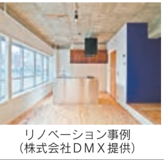
リノベーション事例

*その他にも個人番号が必要になる場合があります 日時 2月28日(日) 午前10時30分〜正午 場所 メイトム宗像・202会議室 テーマ 「中古住宅をリフォーム・リノベーションして豊かに暮らそう」 講師 株式会社DMX(福岡R不動産) 対象 子育て世帯、住宅の購入を検討している人 定員 先着30人程度 申込締切日 2月24日(水) 申込・問い合わせ先 建築課 ☎(36)5203