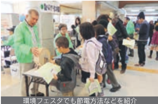
環境フェスタでも節電方法などを紹介