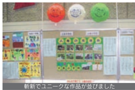
斬新でユニークな作品が並びました

市では、人権のまちづくりの取り組みの一環として、昨年12月5日、同6日、宗像ユリックス・イベントホール前で、「人権啓発作品展」を開催。市内の小・中学生の「人権ポスター」「人権標語」と、障がいのある人が描いた絵画や写真などを展示しました。来場者からは「人権標語の言葉一つ一つに重みがあります。差別やいじめがない学校や社会になるようにと願います」などの声を聞くことができました。また、「人権の花運動」に取り組んだ大島小中学校のパネル展示では「子どもたちの飛ばした種が、どこかで花を咲かせるといいですね」という温かい言葉ももらいました。この作品展を通して、一人一人が人権尊重の気持ちや態度を習慣化し、日常化できるようになればと思います。問い合わせ先 人権対策課 ☎(36)1270