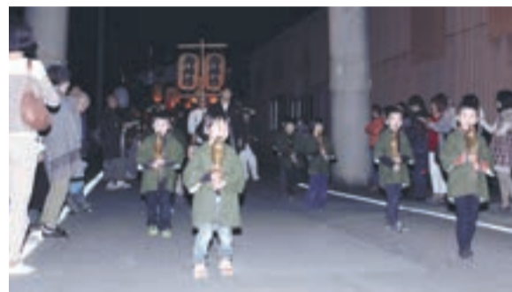
地域行事で役割を担う子どもたち

大切な自尊感情 自尊感情とは、「自分を価値ある存在であると感じる」「自分を大切に思える」「気持ちのいいこと」です。自尊感情の高い子どもは精神的に安定し、何事にも意欲的で前向きです。自分を律し、自分を大切に生きた方ができます。これに対し、