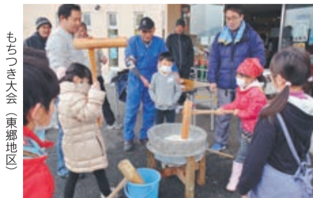
もちつき大会 (東郷地区)

▽地域の行事にも積極的に関わり、たくさん目を見てもらおう機会をつくりましょう。平成27年度全国学力・学習状況調査によると、宗像市の子どもたちが地