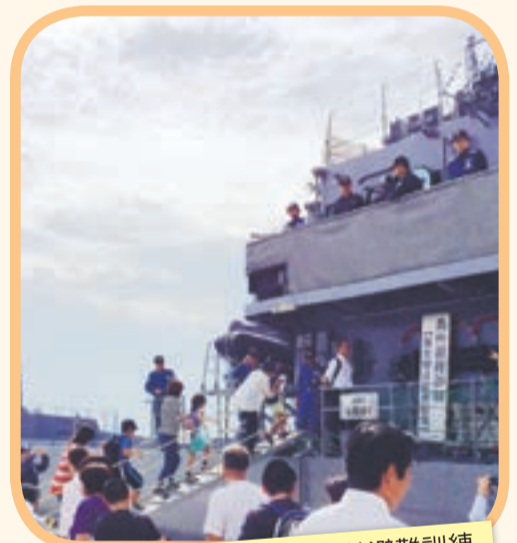
自衛隊の艦船による島外避難訓練

9月12日、宗像市全域で防災訓練を実施しました。大島、地島では、島民や警察、消防、自衛隊、医療法人など関係機関合わせて約600人が参加しました。