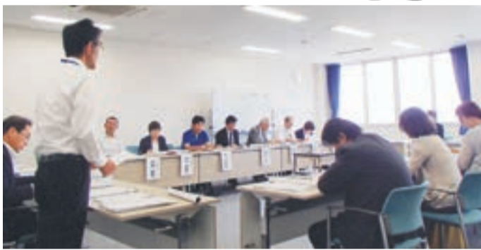
さまざまな意見交換がありました

「平成27年度第1回市障害者自立支援協議会」を5月27日に開催しました。新たな委員8人を迎え、18人で同26年度の就労部会、生活部会、ネットワーク会議それぞれの活動実績報告や、同27年度の活動予定、第3期市障害者福祉計画の進捗(しんちよく)状況、第4期同計画についての説明などがありました。