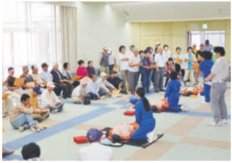
心肺蘇生について真剣に学ぶ参加者

東郷地区で6月7日、大雨による災害への備えを想定した訓練を実施しました。当日は、避難勧告などの情報伝達訓練、避難所の開設、住民避難、備蓄品の取り扱い訓練、応急手当て訓練、給食訓練（炊き出し）などを体験しました。 備蓄品の取り扱い訓練では、組み立て式トイレ、テントなどの避難所資機材の組み立て、担架やりヤカーの使い方も実施。女性消防団の応急手当てやAEDの取り扱いの説明もあり、参加者は熱心に話を聞いていました。 市民のみなさん、もしものときに備え日頃から事前の対策をしましょう。 ■問い合わせ先 地域安全課 ☎(36)5050