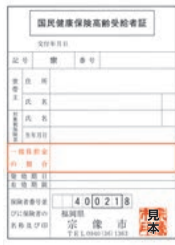
国民健康保険被保険者証と一緒に医療機関の窓口に表示してください

市では、国民健康保険に加入している70歳から74歳までの人へ、8月から使用する「国民健康保険高齢受給者証」を郵送します。8月1日（土）以降に医療機関で受診するときは、更新 ● 対象 国民健康保険加入者で、昭和15年8月2日から同20年8月1日まで生まれた人 ● 郵送時期 7月中旬 ● 対象 国民健康保険加入者で、昭和15年8月2日から同20年8月1日まで生まれた人 ● 対象 国民健康保険加入者で、昭和15年8月2日から同20年8月1日まで生まれた人