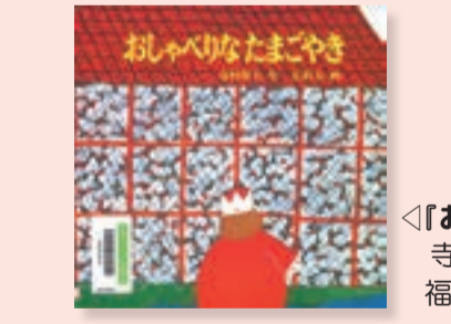
△『おしゃべりなたまごやき』 寺村輝夫 作 / 長新太 画 福音館書店