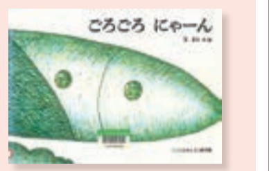
△『ごろごろ にゃーん』 長新太 作・画 福音館書店