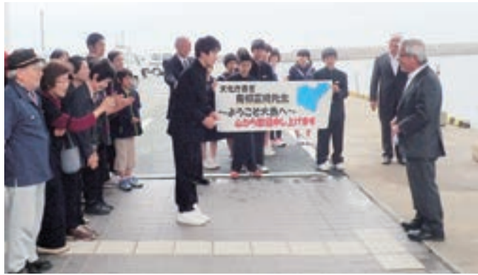
大島港渡船ターミナルで大島中学校の生徒らに歓迎を受ける青柳さん(右)

文化庁長官・青柳正規さんが5月15日、同16日、「神宿る島」宗像・沖ノ島と関連遺産群の構成資産を視察しました。16日の午後は、カメリアホール(福津市文化会館)での世界遺産シンポジウムで、約5