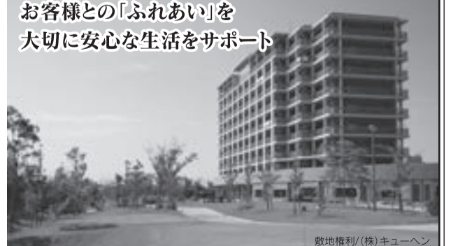
敷地権利/(株)キューヘン

住所/〒811-3214 福岡県福津市花見が丘3丁目28番2号 ホームページを更新しました。九電ケアタウン 検索