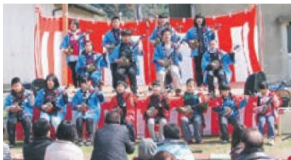
地元小学生によるステージイベント(昨年の泊港会場)