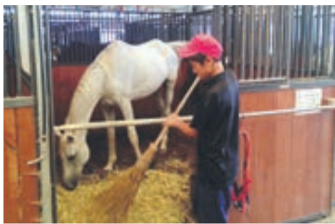
乗馬クラブでの勤務の様子

今年も、9月8日から同12日までの5日間、市内全中学校の2年生約850人が、市内の事