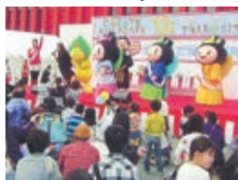
今年もゆるキャラが大集合

市が推進している「市中心商業地等活性化事業」の一環として、NPO法人グランドワーク宗像がくりえいとフェスタを開催。ステージイベントやご当地グルメブースが会場を彩ります。イベントの目玉のパレードでは、市内で活躍する団体や県内各地から集まったゆるキャラが、くりえいと桜通り(市道土穴・朝町線の一