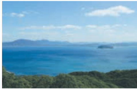
大島御嶽山展望台からの眺望

*詳細は、市HP http://www.city.munakata.lg.jp/ → 「市内にお住まいの方」 → 「くらしと生活環境」 → 「都市づくり」 → 「お知らせ」 で確認か問い合わせを