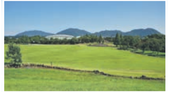
宗像ユリックス・芝生広場からの眺望