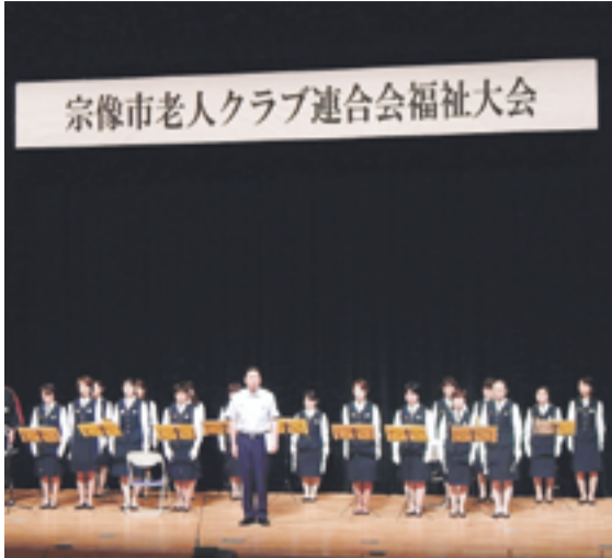
ドキドキしながら劇と演奏を披露しました

老人クラブ連合会福祉大会が、7月5日に宗像ユリックス・ハーモニーホールで開催され、救急救命劇とクワイアチャイムの演奏を披露しました。大きな会場で披露するのは初めてで緊張しましたが、会場のみなさんの温かい拍手と笑い声にホッと安心しました。今後も、楽しく親しみやすさを持った、女性ならではの救命講習の周知と防火の啓発ができればと思います。