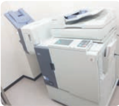
助成金で購入したカラー印刷機

自由ヶ丘地区コミュニティ運営協議会では、宝くじの助成金を活用し、カラー印刷機を購入しました。この宝くじ助成金は、財団法人自治総合センターの一般コミュニティ助成事業によるもので、宝くじの受託事業収入を財源にして、地域活動の健全な発展を目的に実施されています。