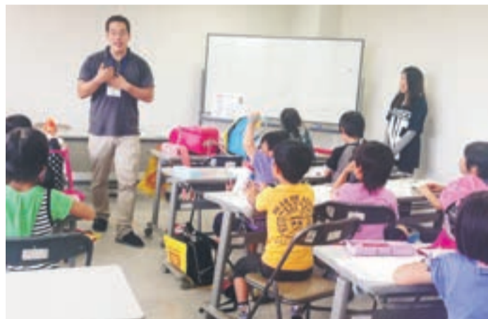
地域で活躍するALT（吉武地区コミュニティ）

▼学力向上支援事業 指導方法の工夫改善に取り組み、小・中学校に、市独自の非常勤講師24人を配置します。