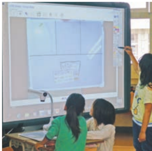
電子黒板での授業風景

その具体的な手立てや効果的な指導を支える条件整備が重要となります。平成25年度をもって「第1期中小一貫教育」の調査研究が終了したことを受けて、平成26年度は「第2期中小一貫教育」に向けた準備や更なる充実を図っていく年と位置付け、義務教育9年間を通じた学びの一貫性をさらに充実させ、学校・家庭・地域が連携を深めながら、それぞれの教育力を発揮できるような教育環境づくりに努めます。保・幼・小・中・高・大という異校種間の効果的な接続と連携を図り、子どもたちの健やかな成長を図ります。未来を担う子どもたちに