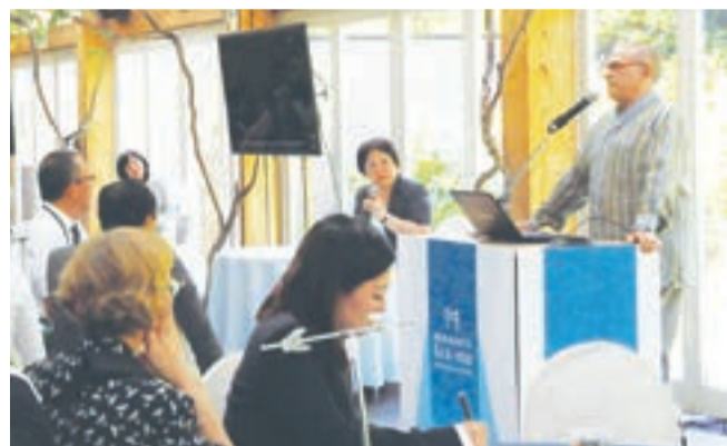
宗像国際環境100人会議

再生戦略の検討に着手 ▼東郷駅周辺の整備や都市計画 市基盤の整備を招いて開催する「宗像国際環境100人会議」の継続実施により、本市の魅力