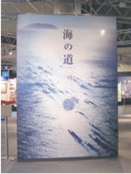
むなかたの過去～現在～未来を学ぶ、海の道むなかた館