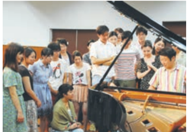
福岡教育大「出前コンサート」