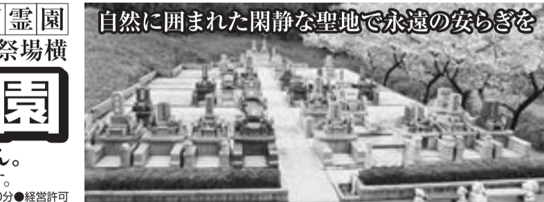
自然に囲まれた閑静な聖地で永遠の安らぎを