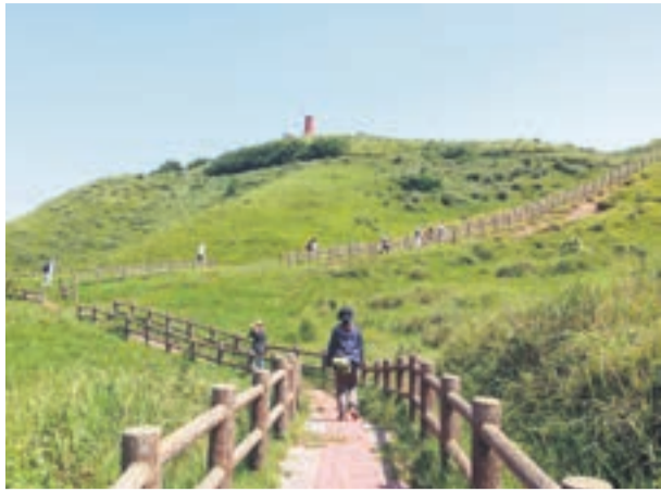
九州オルレ「宗像・大島コース」