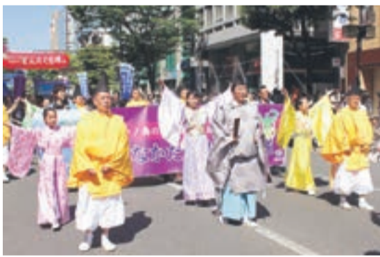
博多どんたくパレードで世界遺産登録をPR