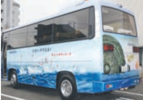
ラッピングバスによる世界遺産登録PR