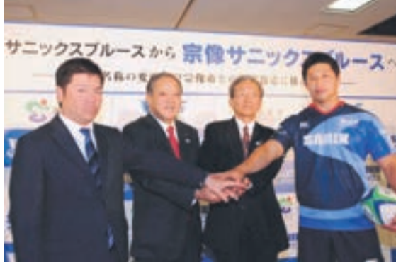
福岡サンニクスブルースが「宗像サンニクスブルース」へ