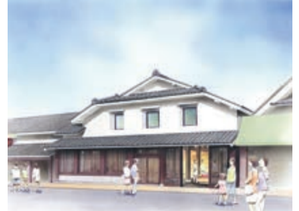
東部観光拠点施設の外観イメージ