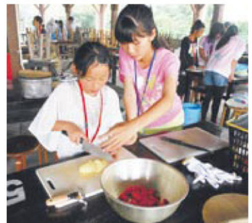
先輩リーダーが優しく指導