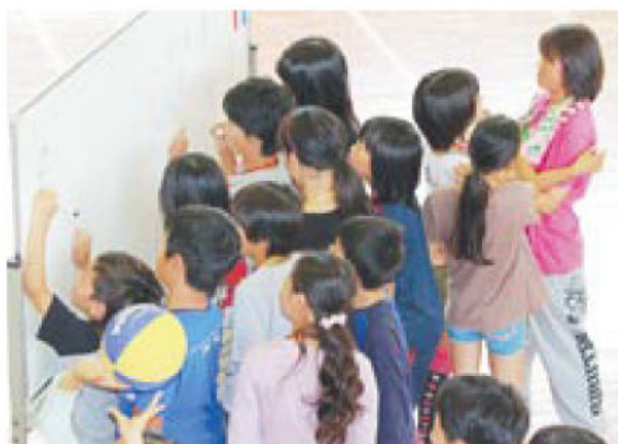
ドッジボール大会のルールなどを計画しました

赤間地区コミュニティでは、「子どもリーダー養成研修」を実施しています。子どもたちは年間を通して、「宿泊研修」「コミュニケーション」「文化祭」「ドッジボール大会」などに参加し、企画・運営などを担っています。文