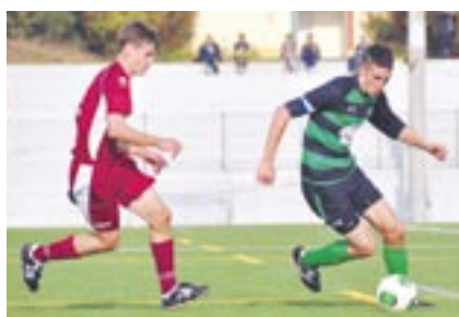
世界から強豪チームが集まります

12回目を迎える「サニックス杯国際ユースサッカー大会」がグローバルアリーナで開催されます。東京オリンピックに出場する世代の選手が集結。U-17日本代表をはじめ、海外の強豪チームや全国で活躍する強豪高校、Jリーグユースチームなどが参加します。大会を制するのはどのチームなのか。注目の1戦をお見逃しなく。