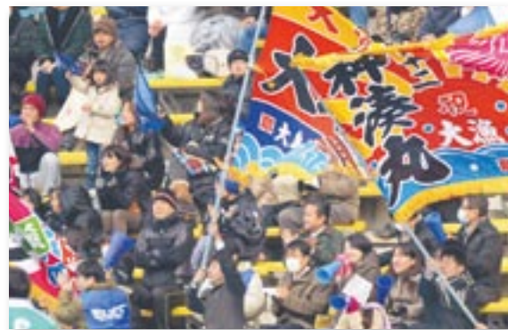
ブルースに声援を送る観客たち

トップリークへの振り返り咲きを目指し、三地域リーグ(トッピーースト、トッピーウエスト、トッピーキウシュウ)の上位チームが対戦するトッピーチャレンジ1に進出した福岡サニックスブルース。このトッピーチャレンジ1で1位になったチームは、トッピーリーグに自動昇格に