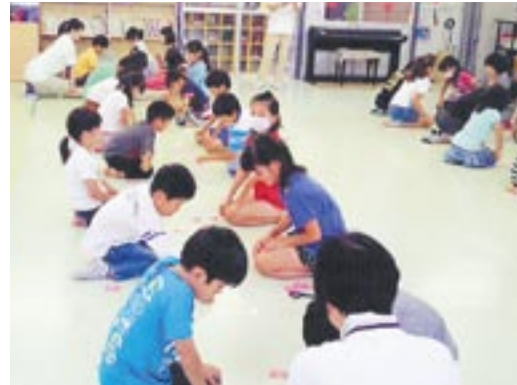
みんなで楽しめる「五色百人一首」

市の学童保育事業の指定管理者(株式会社テノ.コーポレーション)が、平成26年度の入所児童を募集します