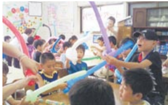
バルーンアートは子どもたちも大喜び

市内の各小学校の敷地内にある専用棟、 小学校教室(右表参照) *大島小、地島小を除く