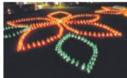
幻想的なキャンドルガーデン