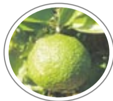
スイートスプリングは熟れても皮が緑色です