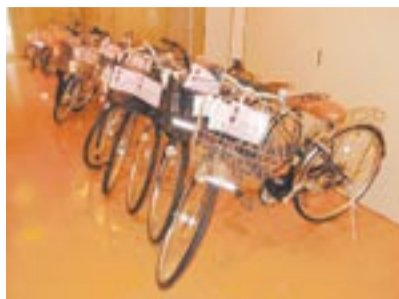
修理再生した自転車

玄界環境組合 宗像清掃工場 (エコパーク宗 像)へ搬入され、 修理再生した家 具と自転車を販 売します。