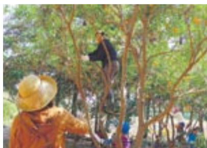
4月の甘夏みかん収穫体験の様子