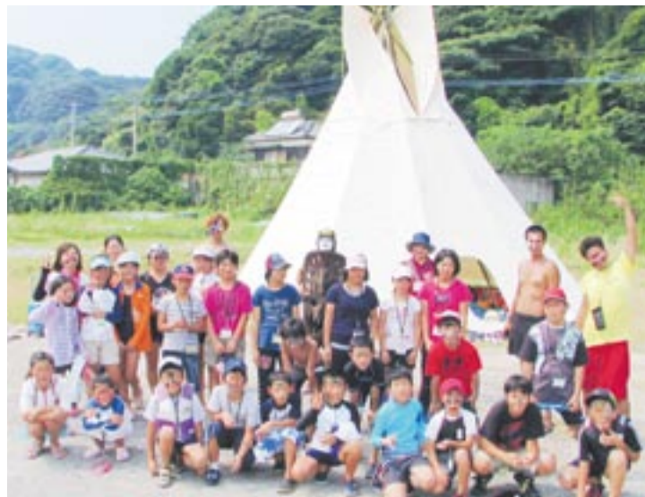
力を合わせて組み立てたティピーの前で記念撮影

1日目、地島の海岸での海洋体験で、子どもたちはシーカヤックや、サーフボードに立って乗り、オールを使ってこぐスタンディングパドル、バナナボートなどを楽しみました。初対面とい