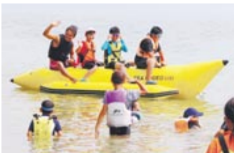
地島泊の海岸で海洋体験

この交流キャンプは、「宗像市元気な島づくり事業」の一環として、宗像ライフセイビングクラブが実施。島外からの参加者12人と漁村留学の子どもを含む地島小学校に通う14人が、カナダ南部、北米平原部、北西部を、移動しながら狩りをする文化を持つ部族の、野営用の住居「ティピー」というテントを建て、寝泊りをしました。