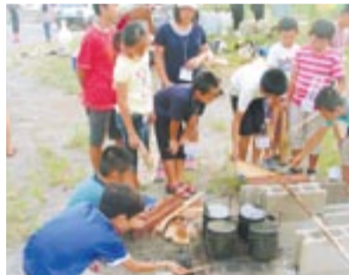
飯ごうでご飯を炊く子どもたち

2日目、ラジオ体操で一日が始まります。朝食を食べた後、島内を散策しました。途中、漁村留学の子どもが共同生活している「なぎさの家」を紹介。また、「みんな元気に海で遊んだり、釣り