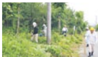
アダプトプログラムに参加して地域貢献

受注した仕事を実施する 会員を募集しています 入会説明会を、毎月第2・4水曜日の午後1時30分から同センターで実施しています。ぜひ参加してください。 入会要件 健康で働く意欲のある60歳以上の市民/同センターの趣旨に賛同する人/所定の会費を納入する人 *仕事は、請負、委託、派遣のいずれかの方法によって実施します *公平に仕事をしてもらうため、ローテーションで就業します ●入会方法 入会説明会に参加し、入会申込書を提出してください ●会員の声 入会してよかったです。仕事だけでなく、人の輪が広がったことに感謝しています(広陵台) ■問い合わせ先 ▼高齢者支援課 ☎(36)1285 ▼市シルバー人材センター ☎(33)1151 同センターHP http://munaka-ts-sc.com/