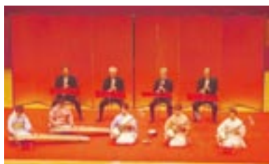
三味線や琴による美しい演奏

市と共催で文化協会10団体と一般11団体が日頃の活動の成果を発表する文化祭。みなさん、ぜひ来てください。