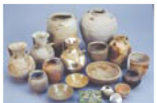
展示室に展示予定の鴻臚館(こうろかん)出土遺物