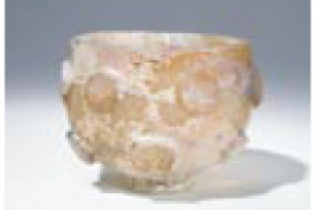
特別展示室に展示予定の円形浮出(うきだし)切子碗