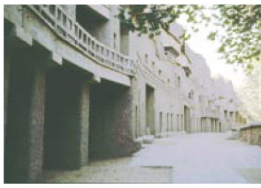
敦煌の石窟寺院「莫高窟」