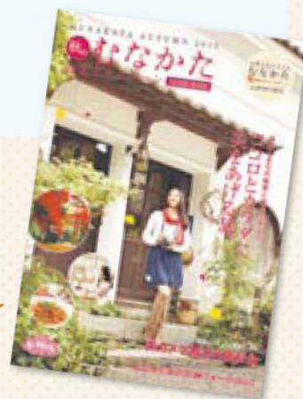
秋の観光キャンペーンのパンフレット