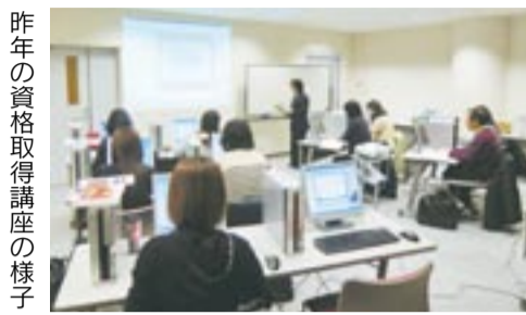
昨年の資格取得講座の様子

再就職のために資格を取ろうと思って受講を決めました。講座は少人数クラスで、メイン講師のほかにアシスタント講師がいたので、質問もしやすく良い雰囲気でした。