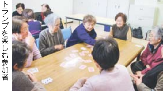
トランプを楽しむ参加者

このコーナーでは、平成19年度から始まった新しい介護予防教室を紹介。7回目は、「快刺激」で認知症予防に取り組むケアポート玄海の「きらめき教室」を紹介します。 ■問い合わせ先 健康づくり課 ☎(36) 1187