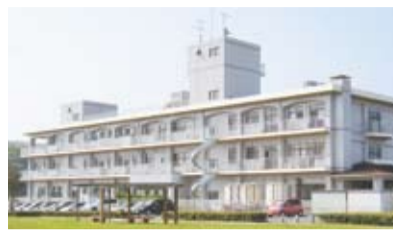
玄海地区の「きらめき教室」を開催しているケアポート玄海

「きらめき教室」は、集団活動と個人活動で認知症予防に取り組む教室です。認知症予防は、日ごろの地道な取り組みが求められます。つまり、「認知症予防活動の習慣化」です。特別なことをするのではなく、自分たちでできる認知症予防活動が大切です。