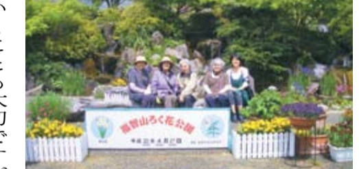
バスハイクで福智山ろく花公園へ