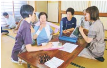
血圧測定で健康状態を確認 (地島)