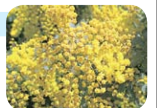
女性の祭日に贈られるミモザの花

イタリアでは「女性の祭日」と呼ばれ、男性が母親や妻、恋人や友人ら親しい女性へ黄色いミモザの花を贈る習慣があります。最近では、女性同士で贈り合うことも多いようですが、この時期は花屋の店先がミモザの黄色い花でいっぱいになります。