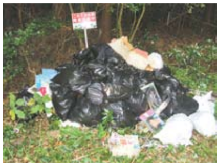
今回発見された不法投棄ごみ

田島地区の鳥越下池付近で昨年10月上旬、住民が不法投棄された大量のごみを発見。連携した通報で、早期に解決することができました。