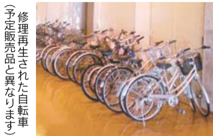
修理再生された自転車（予定販売品と異なります）